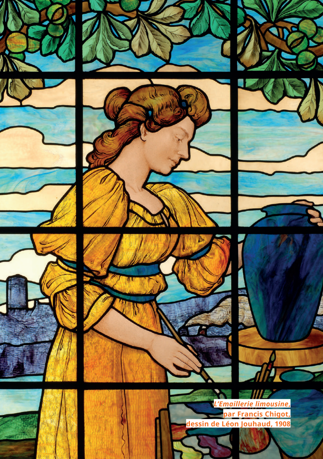
L'Emaillerie limousine, par Francis Chigot, dessin de Léon Jouhaud, 1908