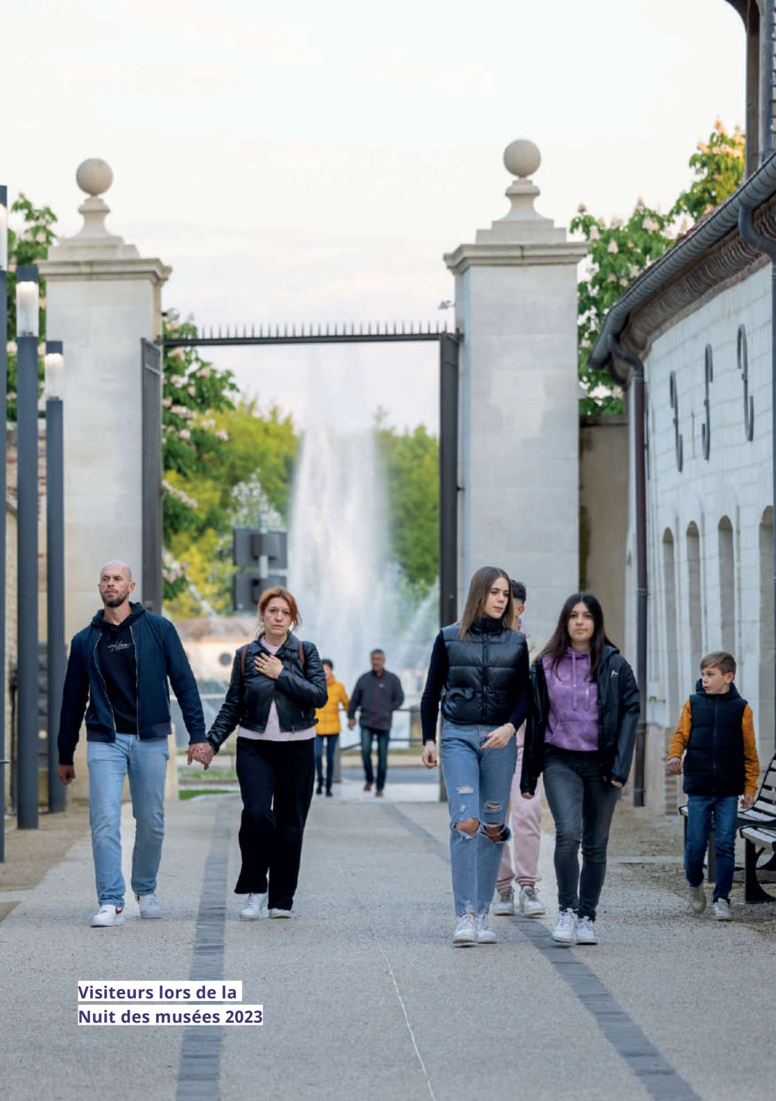
Visiteurs lors de la Nuit des musées 2023