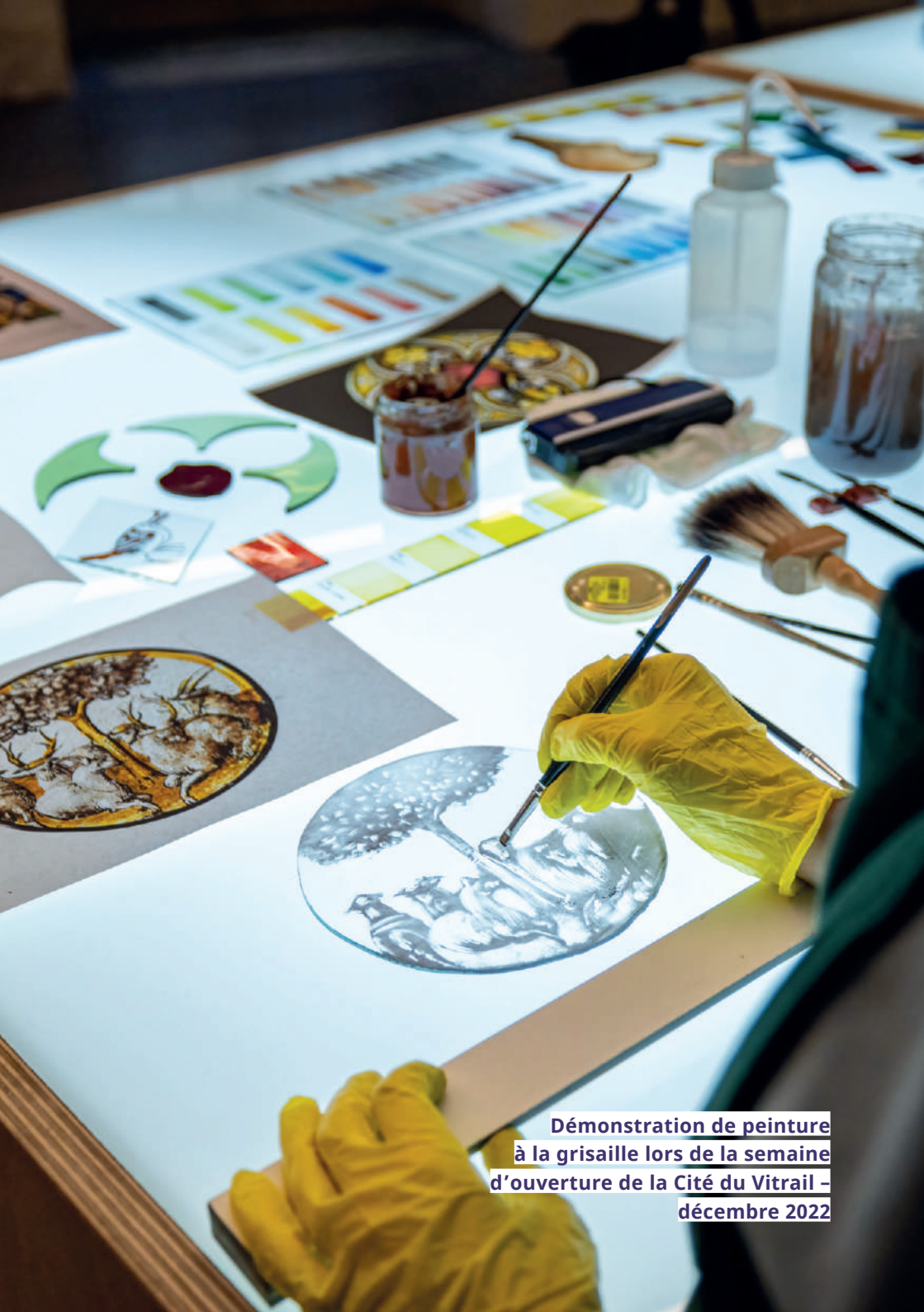
Démonstration de peinture à la grisaille lors de la semaine d'ouverture de la Cité du Vitrail - décembre 2022