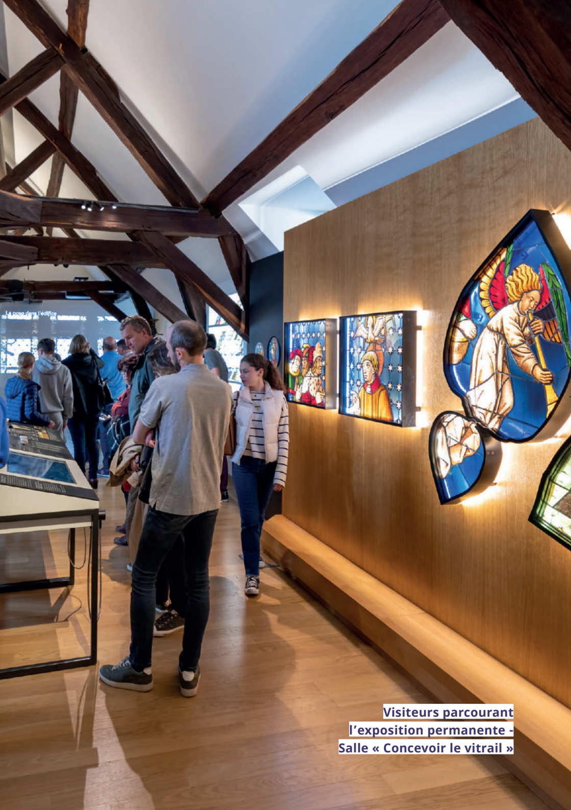
Visiteurs parcourant l'exposition permanente - Salle « Concevoir le vitrail »